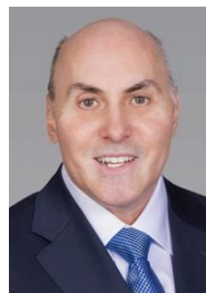
ドリュー・ワイスマン博士