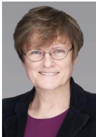
カタリン・カリコー博士